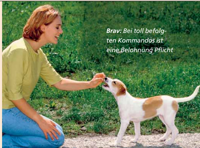
Brav: Bei toll befolgten Kommandos ist eine Belohnung Pflicht

Nach den Regeln der „positiven Bestärkung“ werden Hunde für erwünschtes Verhalten belohnt, um es positiv zu verankern. Am einfachsten ist dies mit der